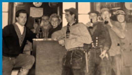
Treffpunkt Tresen: Blick in die Kneipe „Biertonne“ in Trier-West in den 1950er-Jahren © Tilly Wollmann.