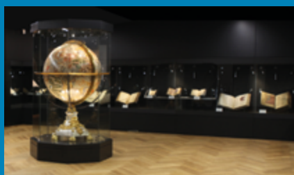
Blick in die Schatzkammer