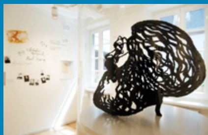
Blick in die Dauerausstellung des Karl-Marx-Hauses © Linda Blatzek/Karl-Marx-Haus.